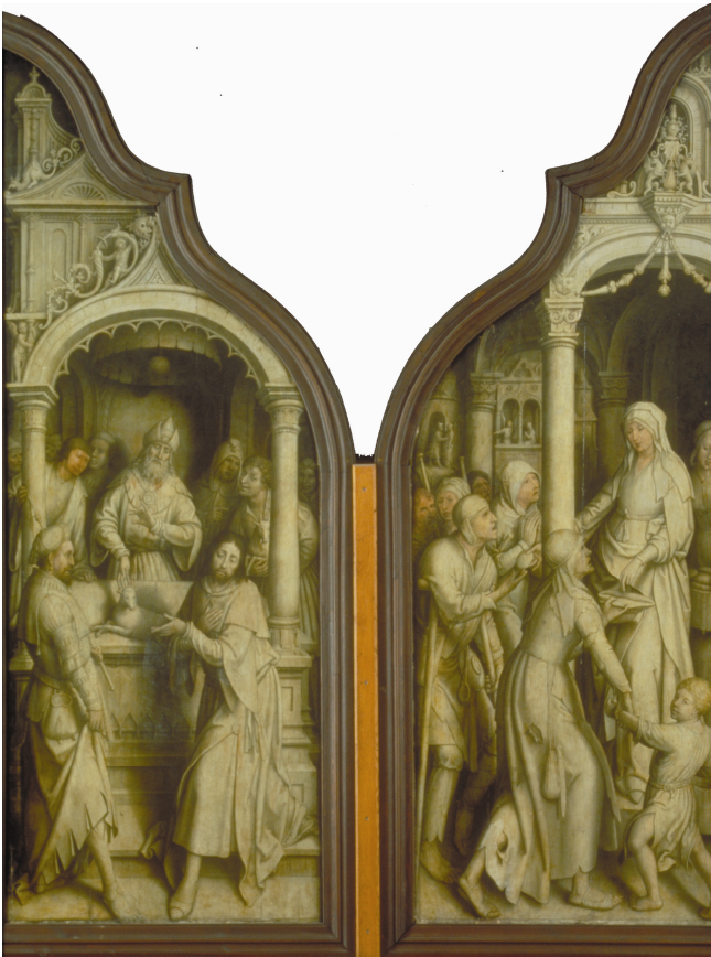
Le triptyque de l'Immaculée Conception (face extérieure des volets)