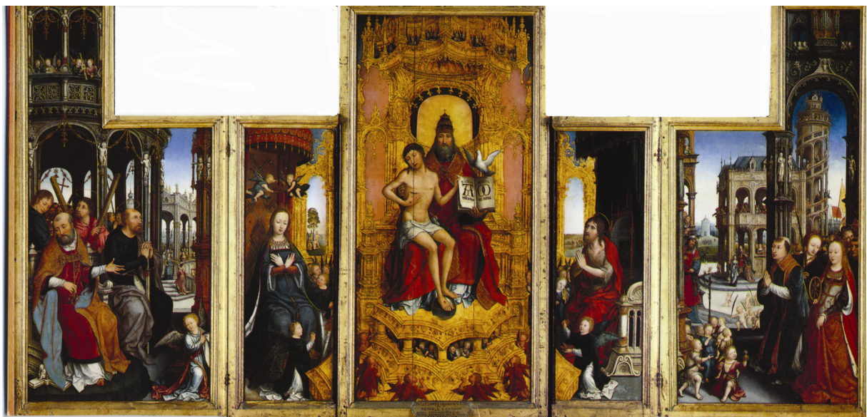
Le Polyptyque d'Anchin ouvert

« Il faudrait faire un livre tout entier si l'on voulait décrire ce prodigieux tableau, rappeler les innombrables détails d'architecture, décrire tous les groupes, dire tous les épisodes, toutes les merveilles qui le remplissent. On ne comprend pas qu'un homme ait réuni une puissance de génie assez grande, une science assez multiple dans toutes les parties de son art, et une ferveur de patience assez infatigable pour concevoir, exécuter et mener à fin une œuvre aussi considérable. »