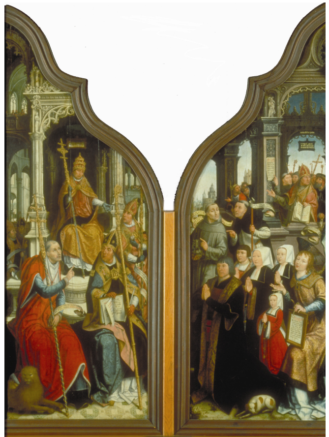
Le triptyque de l'Immaculée Conception (face intérieure des volets)