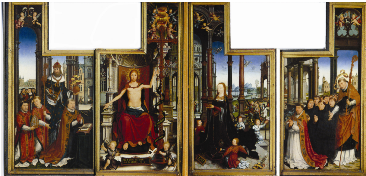
Le Polyptyque d'Anchin fermé